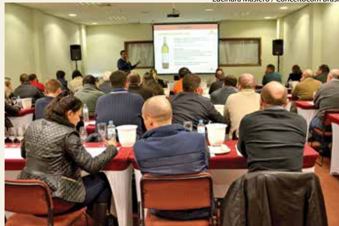
Associados tiveram a oportunidade de degustar vinhos portugueses