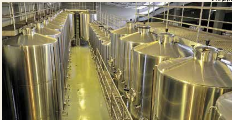
Avanços tecnológicos fazem parte da pauta do evento