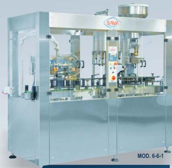
MONOBLOCO AUTOMÁTICO PARA ENXAGUAR, ENCHER E TAPAR