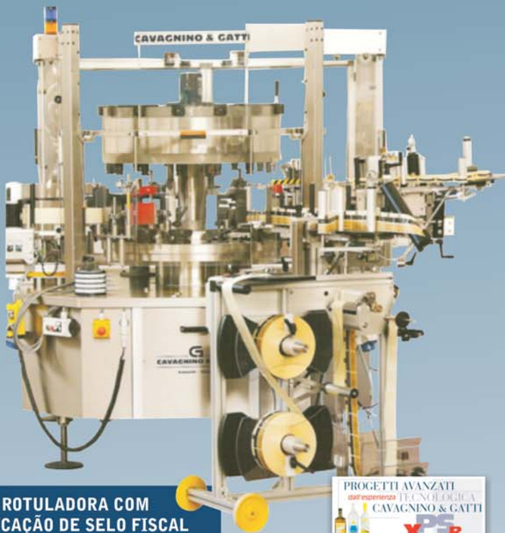
ROTULADORA COM APLICAÇÃO DE SELO FISCAL