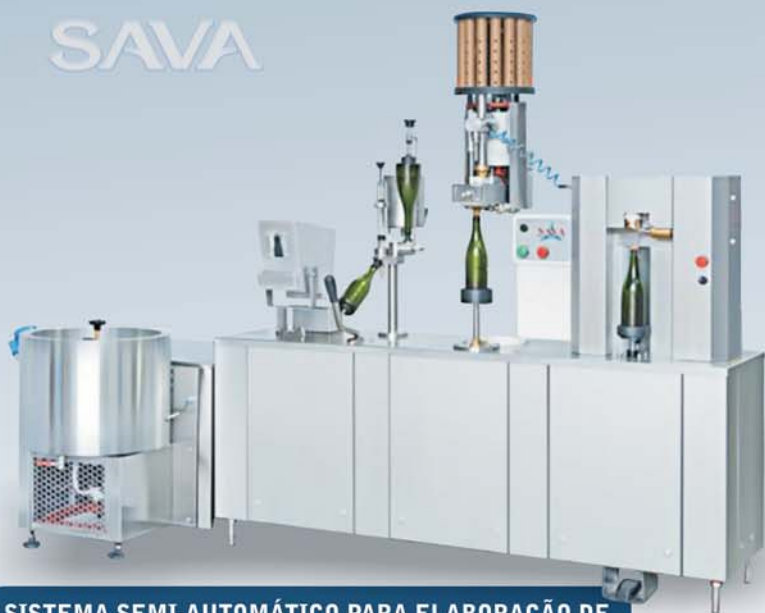
SISTEMA SEMI-AUTOMÁTICO PARA ELABORAÇÃO DE ESPUMANTE MÉTODO TRADICIONAL (CHAMPENOISE)